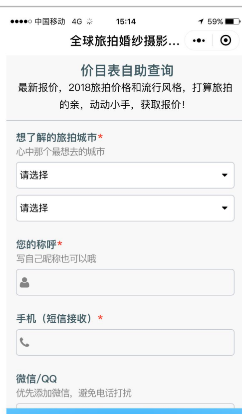
小程序第二屏 表单互动+极短填写项+在线咨询