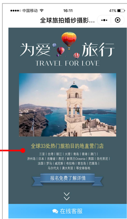
小程序首页 标题+视频