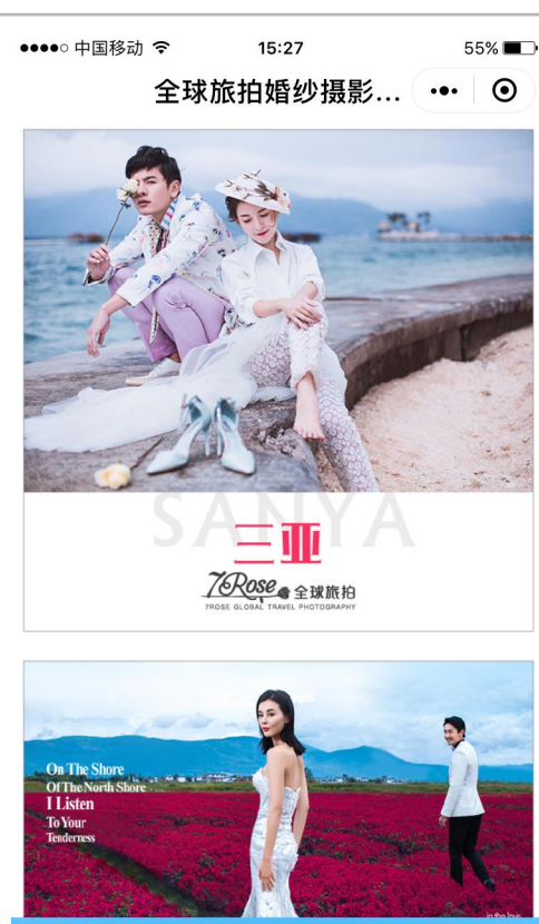
旅拍地样片赏析 展示各景点的拍摄样片