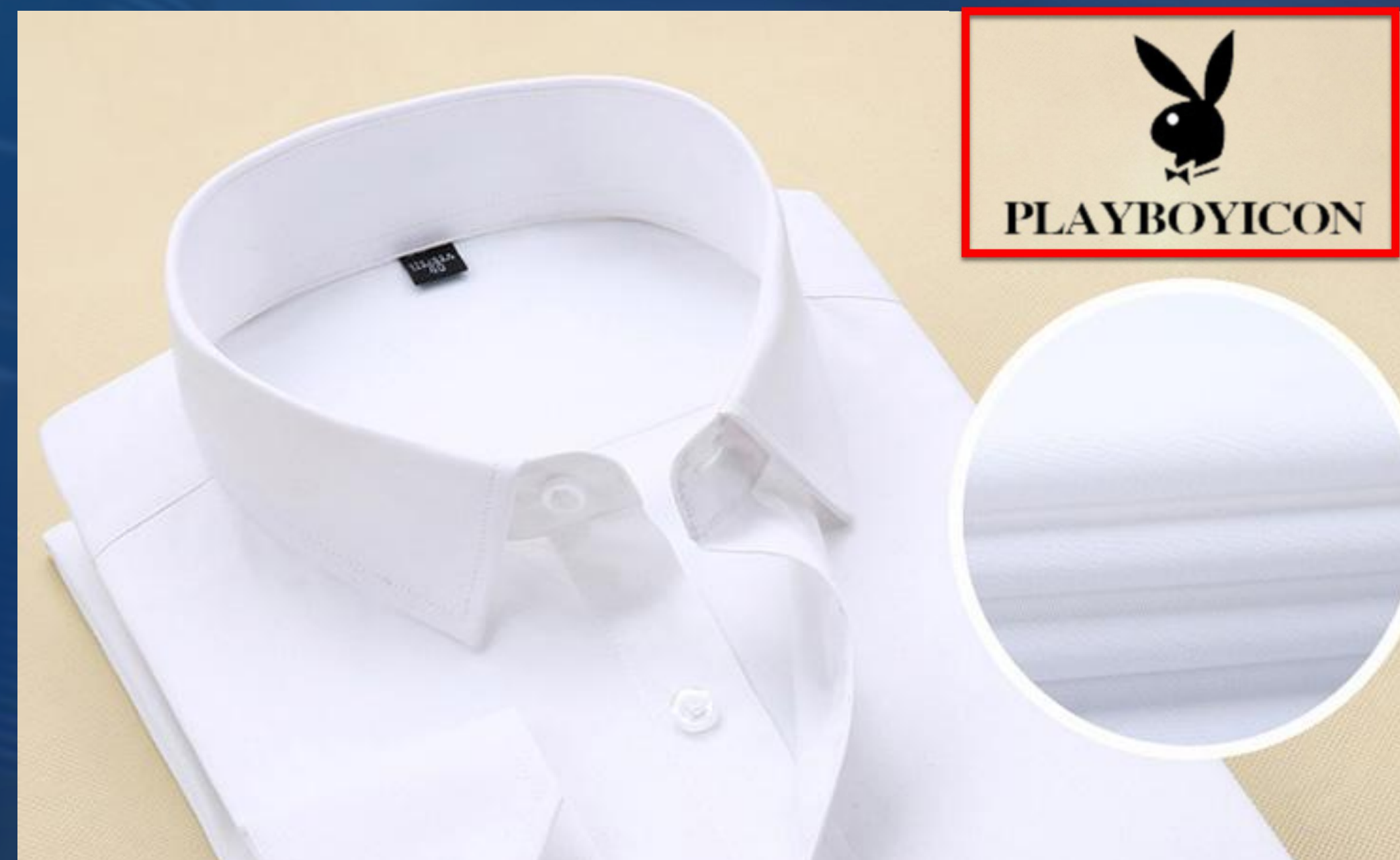
落地页审核通过后变更